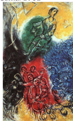
Рисунок 5. Музыка. 1962

Данный процесс для такого художника, как Шагал, был объективно неизбежен. К тому же сама натура, послужившая в свое время содержательной основой для формирования собственного художественного стиля Шагала, постепенно отодвигалась в пучины памяти, и возникала ситуация, при которой человек помнит не столько воспринятые образы и некогда происшедшие события, сколько собственное их изложение — вербальное или изобразительное. В результате сами эмоции, отображенные в поздних картинах Шагала, приобрели вторичный характер. Натура, служившая основой для произведений Шагала, ныне уже не существовала сама по себе; оставались лишь воспоминания о ней.