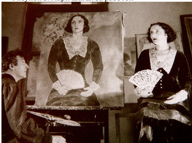
Рисунок 3. Марк Шагал за работой

образом различаться, например, в зависимости от того, отдавал ли автор в то время дань увлечению кубизмом или отходил от него (рис. 4). Кубизм как направление характеризуется не просто наличием выраженной схематизации, но и попыткой придать этой схематизации вполне определенное, общее содержательное наполнение, нетождественное содержанию самого изображения. Однако благодаря сохранению других признаков, присущих проявлениям и низших, и высших моторных уровней, полученные таким образом работы оставались в рамках того большого стиля, который создал Шагал и которого он придерживался.