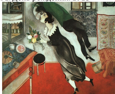
Рисунок 1. День рождения. 1915

особенно заметно на приведенной выше картине «День рождения»). Столь же условно и сходство изображенного с изображаемым; оно не просто далеко, но даже порой и предельно далеко от фотографического (рис. 2).