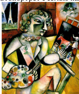
Рисунок 4. Автопортрет с семью пальцами. 1913

Наконец, уровень Е содержит операции с символами — то есть с образами объектов, которые не только обладают самостоятельным (действительным или иллюзорным) бытием, но и приобретают некоторое особое значение, то есть несут в себе функцию означающего по отношению к некоторому означаемому. Если бы данный уровень функционировал в одиночестве, он сообщал бы движение только мысли и чувству, в замкнутых пределах индивидуальной человеческой психики; вещественное, зримое выражение результаты работы этого уровня получают лишь при исполнительской деятельности нижележащих моторик.