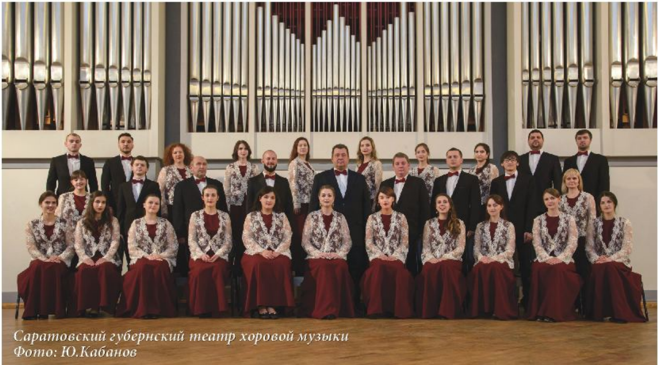
Саратовский губернский театр хоровой музыки

руется. Поэтому дирижеру приходится долго работать, чтобы у каждого певца было четкое представление, как правильно исполнять произведения такого рода. Ведь дикция в православной молитве очень важна и не терпит светской эмоциональности.