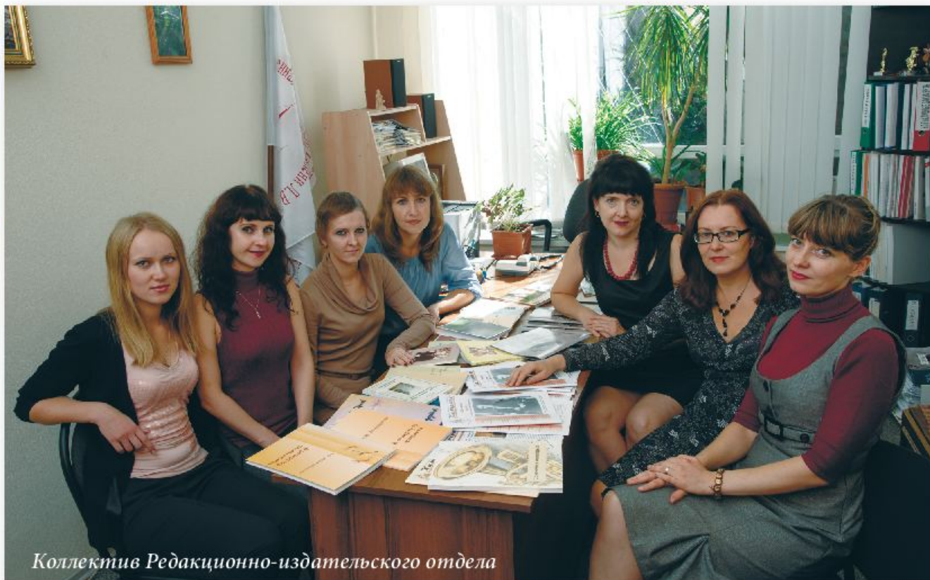
Коллектив Редакционно-издательского отдела

работа для меня, по правде сказать, была тяжелой, и меня тянуло реализовать себя так, как я это себе представляла — в более творческом направлении.