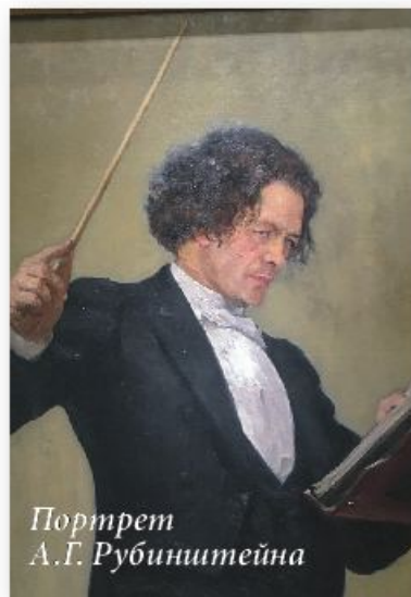
Портрет А.Г. Рубинштейна

Вот они какие – душевные провинциальные музеи, где нет толпы туристов, очереди, чтобы зайти в зал, и страха, что не успеешь обойти все шедевры до закрытия. Данная выставка стала отличным поводом познакомиться с творчеством И.Е. Репина, посмотреть на него с разных сторон. Ведь, действительно, сколько бы художник ни старался, насколько он не был бы знаменит, каждый по-своему увидит его картину.