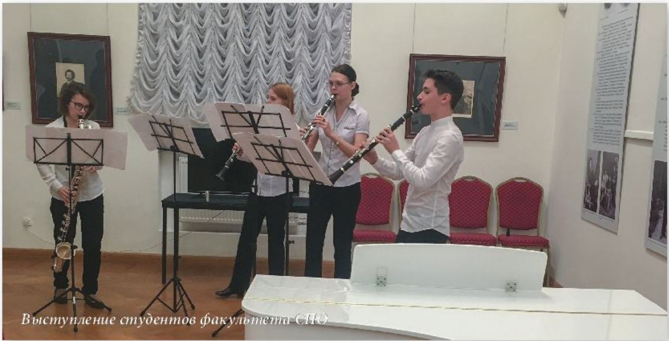
Выступление студентов факультета СПО

сыграло свою роль и колоссальное желание сотрудников музея порадовать жителей и гостей Саратова. В состав экспозиции вошли живописные и графические работы из коллекций Третьяковской галереи, Русского музея, Музея-усадьбы И.Е. Репина «Пенаты», Всероссийского музея А.С. Пушкина, а также ряд полотен, обладателем которых является непосредственно Радищевский музей.