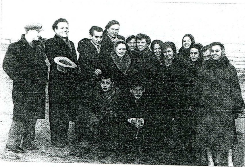
3 апреля 1958 г. Ледоход на Волге.