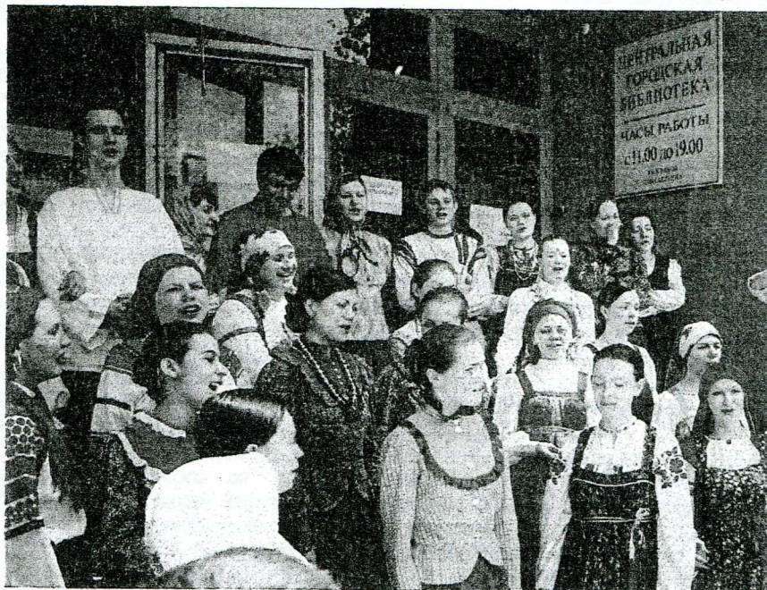
Народный хор Саратовской консерватории (Фестиваль ко Дню славянской письменности и культуры. Май. 2007)

Каждый из учебных ансамблей привносит в хор свою краску, создавая в целом неповторимую тембровую палитру коллектива. В связи со спецификой учебного процесса происходит ежегодное обновление исполнительского состава и соответственно звучания. Ежегодно хор, раскрываясь в новом свете, создает благодатную почву для творческих изысканий хормейстера. Так, в этом году на смену выпускникам (женскому ансамблю) пришел I курс, в составе которого пятеро мужчин. В связи с этим укрепился фундамент хорового звучания, и, значительно возросли фактурные возможности коллектива.