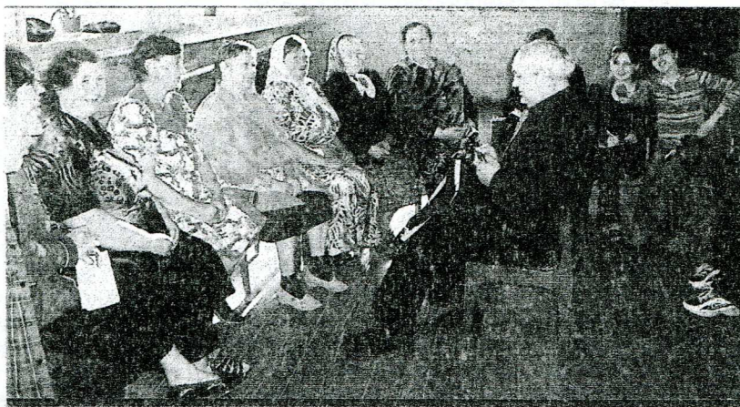
Фольклорно-этнографическая экспедиция в с. Старая Жуковка Базарно-Карабулакского района Саратовской области. 2005 г.