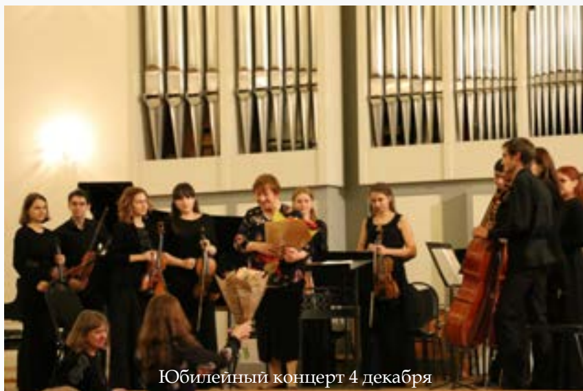
Юбилейный концерт 4 декабря

Т.Б.: Сразу хочу сказать, что мне с этим очень повезло. И именно с первыми азами преподавания, то есть с самого начала. Мне не пришлось потом никуда перестраиваться и никто меня потом не переделывал. Вот это самое главное. Потому что начальное образование – очень ответственный этап. Педагогами музыкальной школы должны быть люди, которые знают перспективы профессии. А если человек их не видит – это большая трагедия. И эта трагедия происходит сейчас в большинстве школ. Будучи