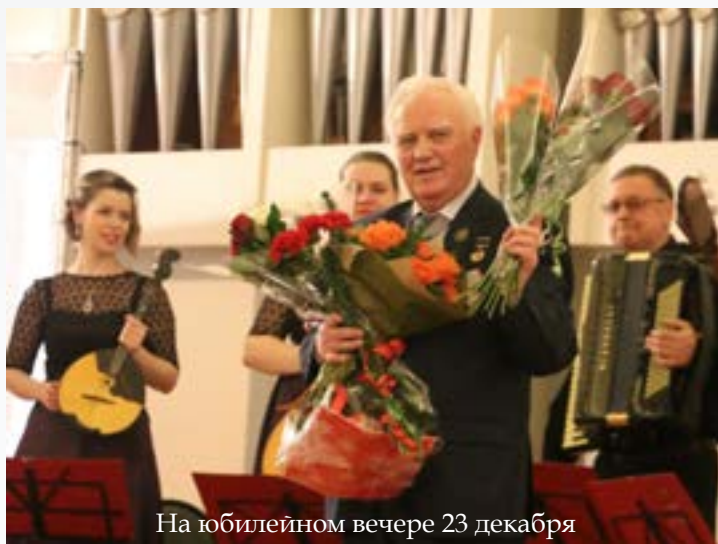
На юбилейном вечере 23 декабря