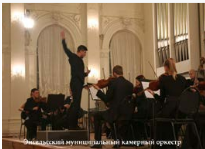
Энгельский муниципальный камерный оркестр

идеей этого крупного проекта, а также раскрыл некоторые особенности организации творческих мероприятий подобного уровня. В совместной дискуссии были затронуты проблемы современного исполнительства, в частности,