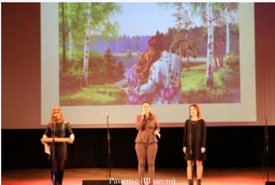
Раменьё (III место)

Неоднократно, но при этом неповторяемо и разнопланово, на наших конкурсах разрабатывается идея музыкального и – шире – творческого образования детей