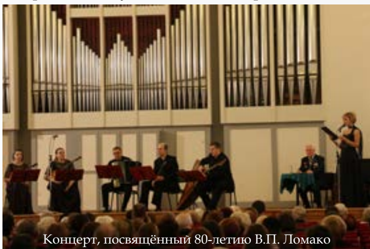
Концерт, посвящённый 80-летию В.П. Ломако

Признанием исполнительского мастерства музыканта стали постоянные зарубежные гастроли