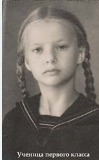
Ученица первого класса

Т.Б.: Да, и Тактакишвили. В связи с этим, я могу сказать и про Эшпая, потому что те произведения, которые он писал, также основаны на близком ему мариийском фольклоре. Они тоже заряжают энергией. И что ни песня – то шедевр. Их будут слушать и сейчас, и через пятьдесят лет, потому что это настоящая музыка, уходящая корнями в фольклорную почву. Хачатурян – ещё более чистый фольклор, исходящий из древних народных жанров, которые в нём невероятно переплавились. Слушаешь его и