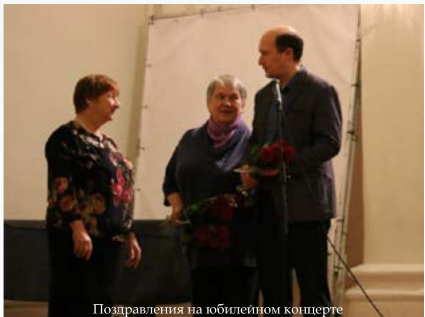
Поздравления на юбилейном концерте

Т.Б.: Да, это сложно, именно так. Нашим солистом был тогда ещё студент московской консерватории