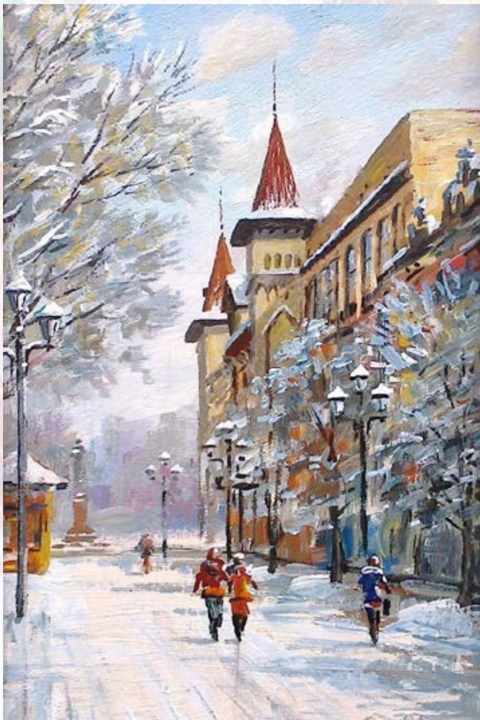
И. Кузьмина «Саратов, зимний проспект»