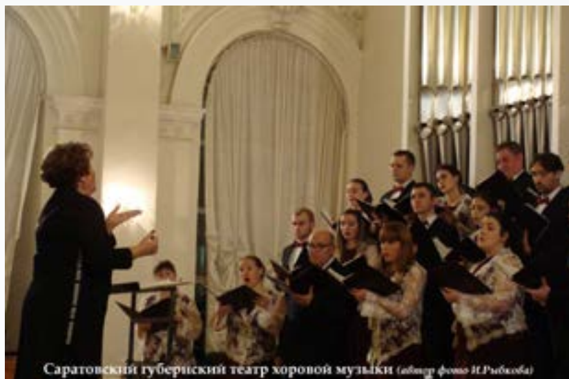
Саратовский губернский театр хоровой музыки

Секрет этого магического воздействия высочайших образцов искусства на душу человека сокрыт в незатейливой, мимоходом брошенной